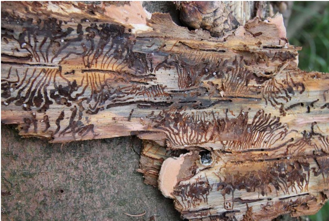
Fraßbild der Borkenkäferlarven

Das nennt man einen Borkenkäfer-Ausbruch. Die Förster müssen dann eingreifen, um den Wald zu schützen. Also, denkt daran, der Borkenkäfer ist ein kleiner Holzfresser mit Superkräften, der dabei hilft, unseren Wald gesund zu halten, aber leider auch ihm schadet. Wenn ihr das nächste Mal im Wald seid, schaut euch die Bäume genau an, vielleicht entdeckt ihr sogar die winzigen Gänge des Borkenkäfers!